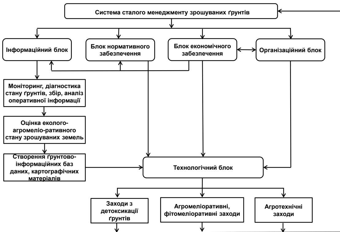
Рис. 1. Структурна схема системи сталого менеджменту зрошуваних ґрунтів

- агротехнічні заходи з розробки структури посівних площ і сівозмін, системи удобрення, обробітку ґрунту та режимів зрошення. Залежно від спеціалізації господарств оптимальна структура сівозмін на зрошуваних землях має включати 35-40 % зернових, не менше 30 % кормових, у тому числі багаторічних бобових трав, насамперед, люцерни – 15-20 %, технічних культур – 10-15 %, овоче-баштанних – 10-15 % [45]. Для сучасних умов характерним є застосування короткоротаційних сівозмін. За зрошення мінералізованими забрудненими водами слід надавати перевагу культурам, які є стійкими до засолення й осолонцювання ґрунту та накопичення важких металів.