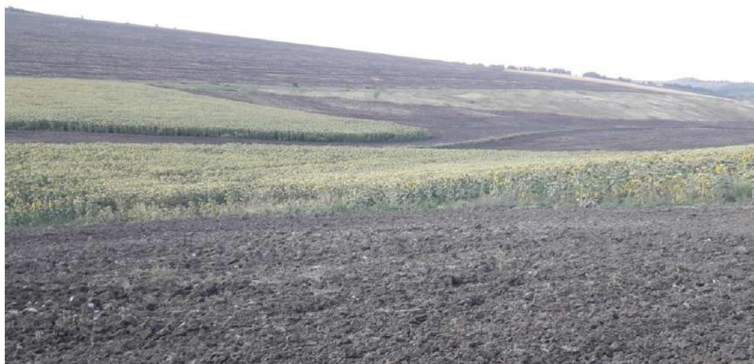
Рис. 1. Розораний схил > 5° (призначення - пасовище) у Новопокровському районі

Причому слід зауважити, що орендаторами обробляються під основні польові культури майже всі можливі площі, незважаючи на цільове їх призначення, і це не завжди відображується у статистичній звітності. Найчастіше до інтенсивного обробітку залучаються незатребувані площі на угіддях сінокосів і пасовищ. Прикладом може слугувати зафіксоване на фото розміщення соняшника на еродованому схилі, який міг би бути захищеним, наприклад, багаторічними травами (Рис.1).